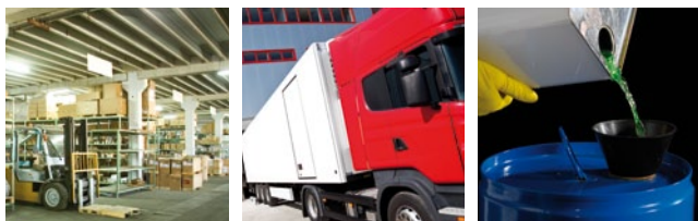
*Comparativa EX4T2 y productos similares del mercado, consumo en modo stand-by.